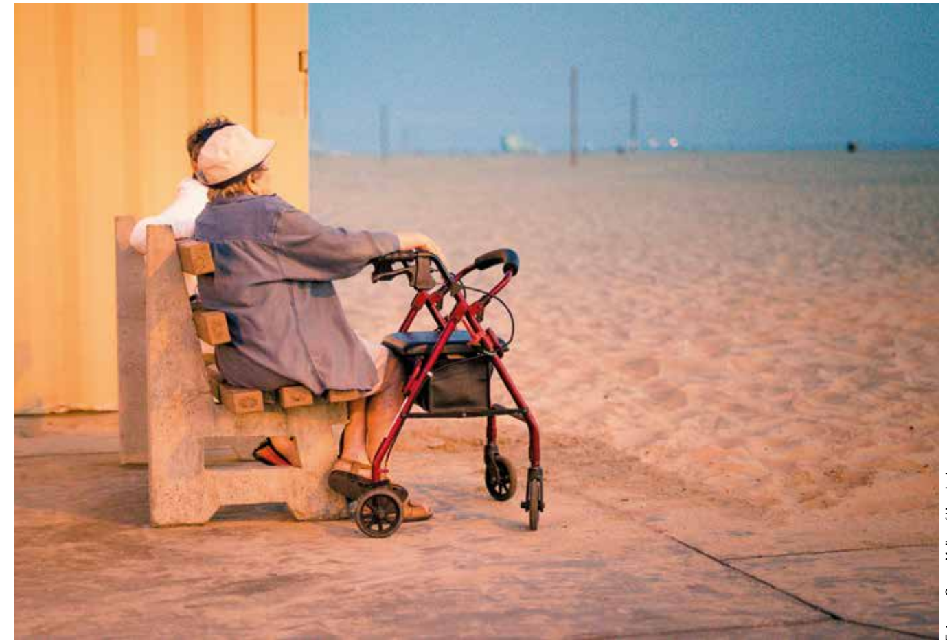
Longevity: Gesund alt werden

Mit dem drei Milliarden Dollar-schweren Human Genome Project unter Beteiligung des Gentechnik-Pioniers Craig Venter wurde 2003 das menschliche Genom entschlüsselt. Ein Meilenstein in der Wissenschaft, zweifellos. Doch leider war diese Version nicht ganz vollständig, es fehlten noch etwa acht Prozent der Erbinformationen. Es gab schlicht keine geeigneten Technologien, um diese unbekannteten Abschnitte zu sequenzieren.